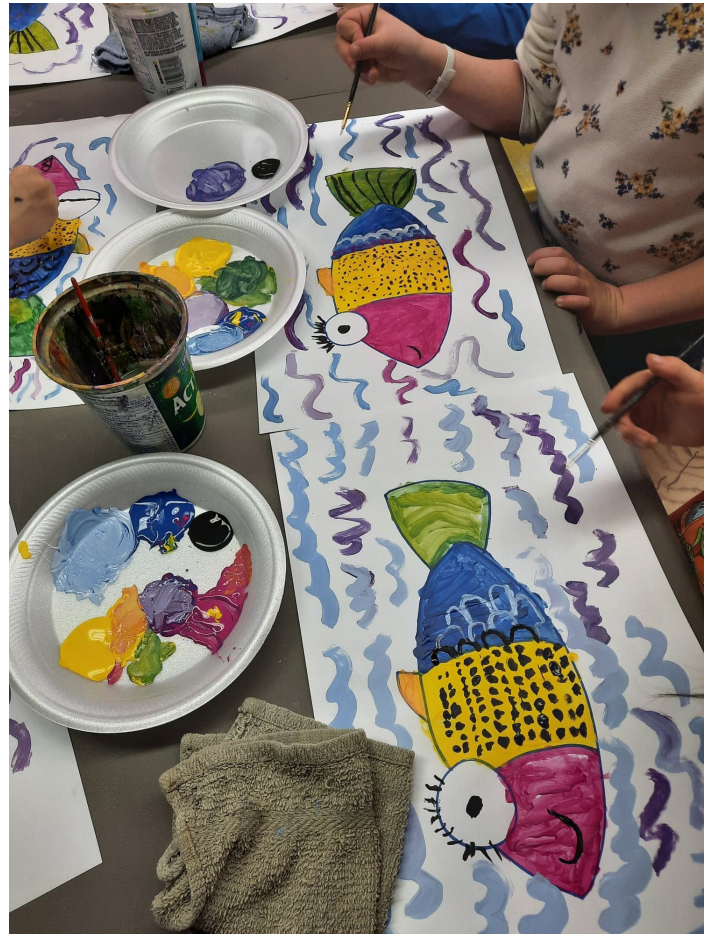
© Caroline Jacques et Gervais Bergeron